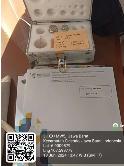
3HXX+MW5, Jawa Barat Kecamatan Cicendo, Jawa Barat, Indonesia Lat -6.9009879 Lng 107.599779 13 Juni 2024 13:47 WIB (GMT 7)