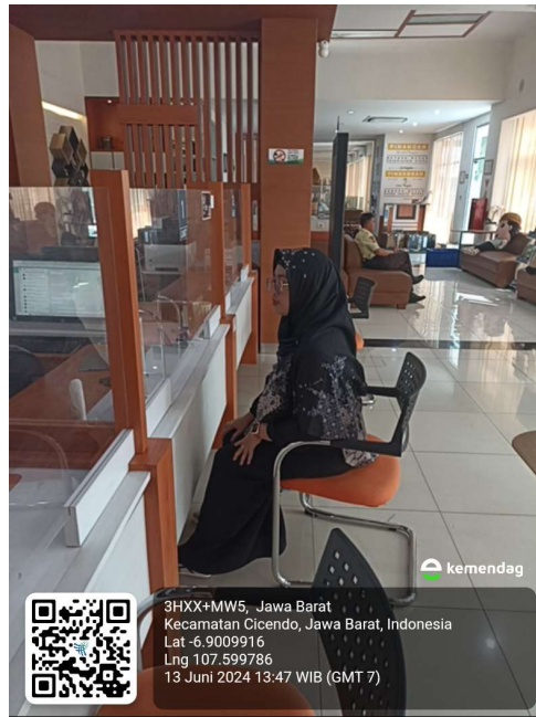
3HXX+MW5, Jawa Barat Kecamatan Cicendo, Jawa Barat, Indonesia Lat -6.9009916 Lng 107.599786 13 Juni 2024 13:47 WIB (GMT 7)