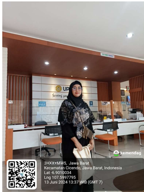
3HXX+MW5, Jawa Barat Kecamatan Cicendo, Jawa Barat, Indonesia Lat -6.9010034 Lng 107.5997795 13 Juni 2024 13:37 WIB (GMT 7)